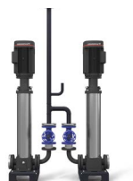
GRUPO DE ALIMENTACIÓN DE AGUA MODULANTE (Opcional con Inversor a bordo de las bombas)