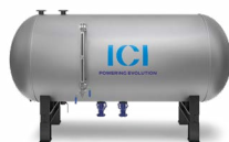
DEG Desgasificador atmosférico