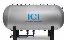
VEX Acumulador de vapor