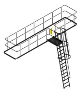
ESCALERA Y BRANDILLA