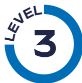
Active Support Plus