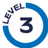
Active Support Plus